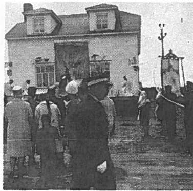
Reposoir de la Fête-Dieu en 1961