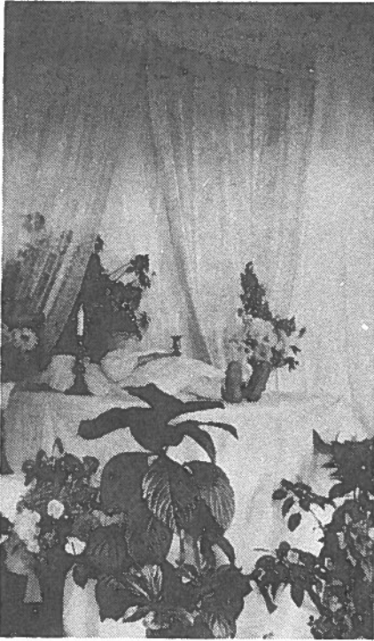
Corps exposé "sur les planches"