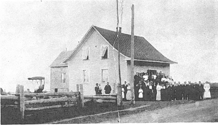
Une noce à la maison d'Ernest Otis